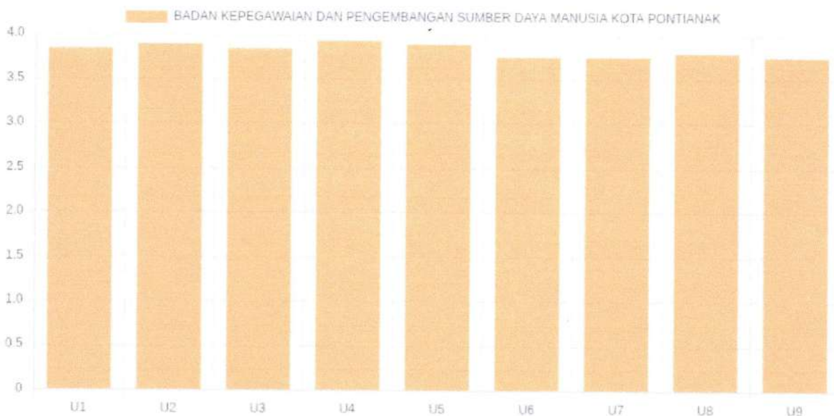
Gambar 1. Grafik Nilai SKM Per Unsur